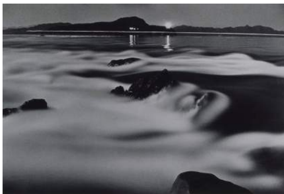
緑川洋一《夜の鳴門急潮》1953年 ゼラチン・シルバー・プリント / printed in 1991