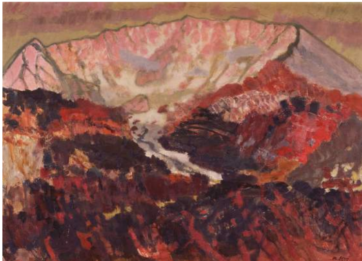
伊谷賢蔵《伯耆大山晩秋》1967年 油彩、カンヴァス