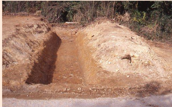
小波城跡の堀切跡

1996年に町道建設に伴い600㎡が淀江町教育委員会により発掘調査され、深さ3.5m、上幅6mの堀切と、高さ0.7mの土塁、溝、建物跡などが発見されました。堀切跡から鎌倉時代の土師質土器や陶磁器が検出されています。