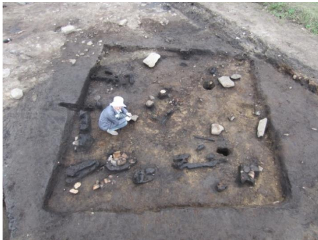
小タイ田遺跡東区竪穴建物跡S I O 2