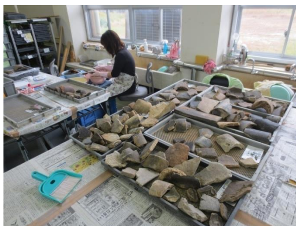
整理中の米子城の瓦

瓦は、平瓦、軒丸瓦、鳥ふすま瓦などが見られ、登り石垣に設けられていた土塀や遠見櫓から落下埋没したものと考えられます。瓦の文様も違いが観られることから、時期の違いが観察されます。今後、分類整理を進めることにより「登り石垣」の構築時期などを解明する手がかりになると考えられます。（佐伯）