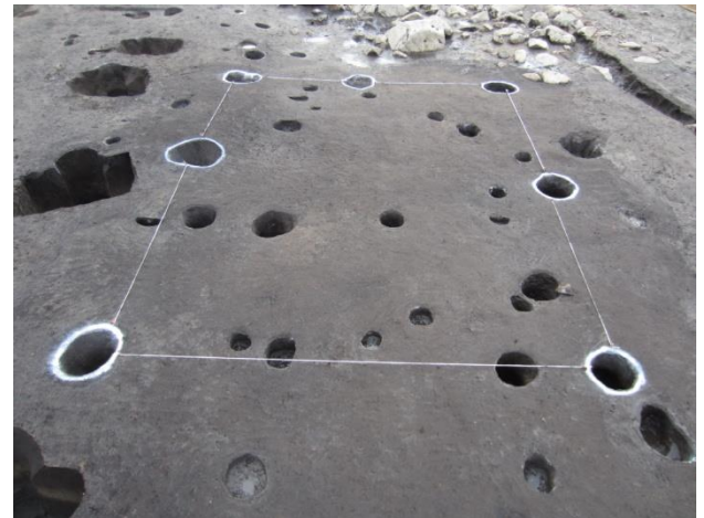
川添遺跡の掘立柱建物跡

(一財) 米子市文化財団埋蔵文化財調査室では、7月末から始めた新屋小タイ田遺跡と新屋川添遺跡の発掘調査をほぼ終え、12月4日には現地説明会を開催しました。