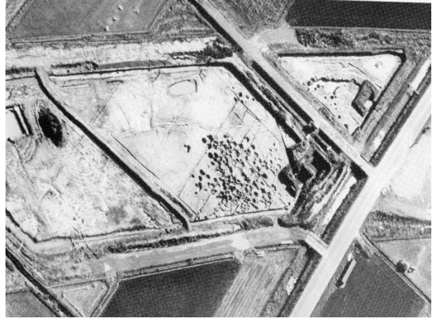
福岡遺跡 1・2区全景

遺物は弥生時代中期の多数の土器のほか、榧、堅杵、掘削具、平鋏、匙等の木製品が出土しています。(小原)