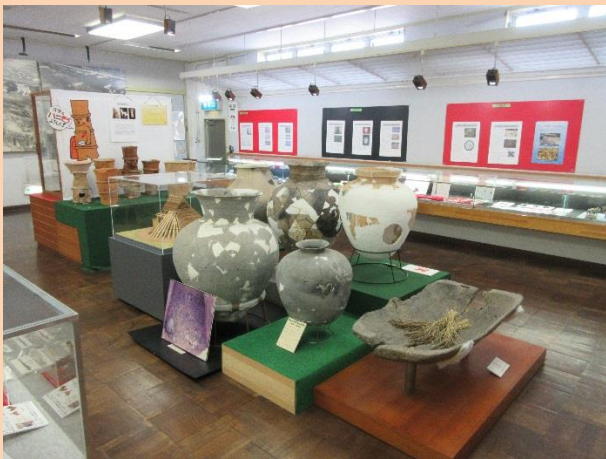
米子市福市考古資料館展示

福市遺跡公園には、広い広場や遺跡の表示のほか桜やツツジなどの花も鑑賞もでき、イチイガシやスタシイ、コナラの木も実をつけます。多くの市民が憩いの場として利用しています。