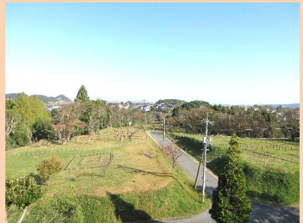
国史跡福市遺跡吉塚地区遠景