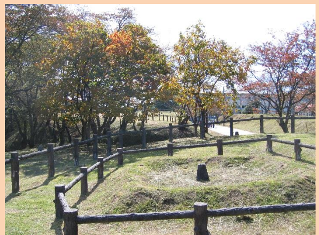
国史跡福市遺跡竪穴遺構表示