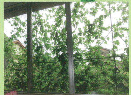
米子市淀江文化センター

フウセンカズラの実がたわわに実りました。白い小さな花も咲かせて夏らしくなりました。