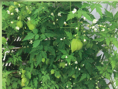
米子市文化ホール

フウセンカズラの実がたわわに実りました。白い小さな花も咲かせて夏らしくなりました。