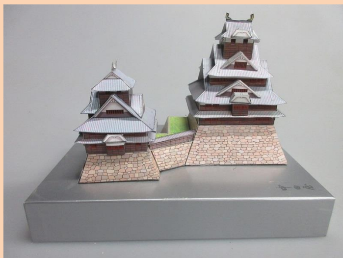
完成した米子城ペーパークラフト