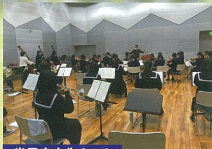
米子市文化ホール