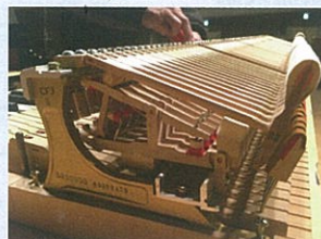
▲弦を打つハンマー

みなさんこんにちは！米子市公会堂の非公式キャラクター「こうかいどん」だよ！ピアノの中って見たことある？蓋開けて見るところじゃなくて、鍵盤の奥の奥の奥。見てみたいよね～。ピアノの保守点検の時に内部を見せてもらったよ！少しだけ紹介するね。