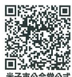
米子市公会堂公式 YouTube はこちらから