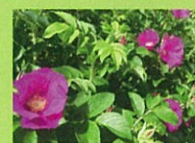
【ハマナス】 皇后雅子さまの御印としても 知られるバラ科の植物