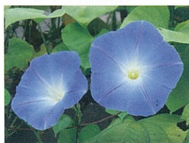
▲緑のカーテンで育てている西洋アサガオ