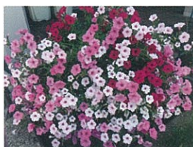
▲ペチュニアの巨大な株