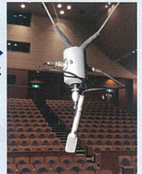
▲米子市文化ホール / メインホール

音楽ホールには、「3点吊りマイク」というものがあります。これは、主に演奏会などの録音用として使用するものです。文化ホールでは、CMS-2 (sanken 社) のマイクを使用しています。コントローラーを使って、上下左右に吊り位置を動かしますが、催物ごとに位置を変えています。ベストな音質で録れる位置だったり、客席等のノイズが入ったりしないようにするためです。毎回、ベストポジションを探すのは大変ですね。