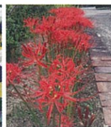
▲写真上 / 公会堂事務所前の通路