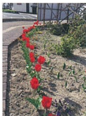
▲チューリップは満開