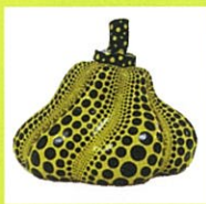
(A Pumpkin) 2008年 セラミック