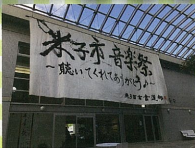
米子市文化ホール

米子市公会堂、米子市文化ホール、米子市淀江文化センターのベストショットを担当者が撮影。3館の日常風景などをお楽しみください。