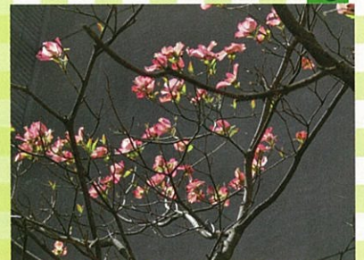
米子市淀江文化センター