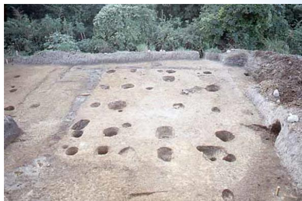
尾高城南大首郭櫓状建物跡

期間 2022年9月7日(水)～ 11月28日(月) (毎週火曜日・祝祭日の翌日休館)