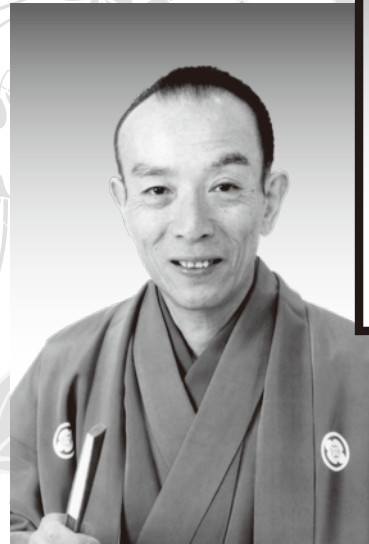
かつら 桂歌丸 うた まる

横浜市出身、中学3年で五代目古今亭今輔に入門、のちに桂米丸門下となる。日本テレビ「笑点」にはスタート時からレギュラー出演し現在は五代目司会者。 芸術祭賞、横浜文化賞、神奈川文化賞、浅草芸能大賞、芸術選奨文部科学大臣賞、松尾芸能優秀賞、昭和19年旭日小綴賞受賞。公益社団法人落語芸術協会会長、横浜にぎわい座館長…(にぎわい座賑々より抜粋)