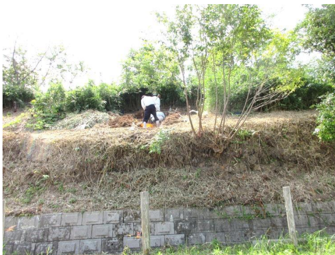
日焼山地区の試掘作業

この福市遺跡ですが、一昨年に日焼山地区の斜面に造られたコンクリート製の擁壁の一部が崩壊する事態が起きました。初期の整備から数十年近くが経過したため、コンクリートが劣化したのが原因のよう