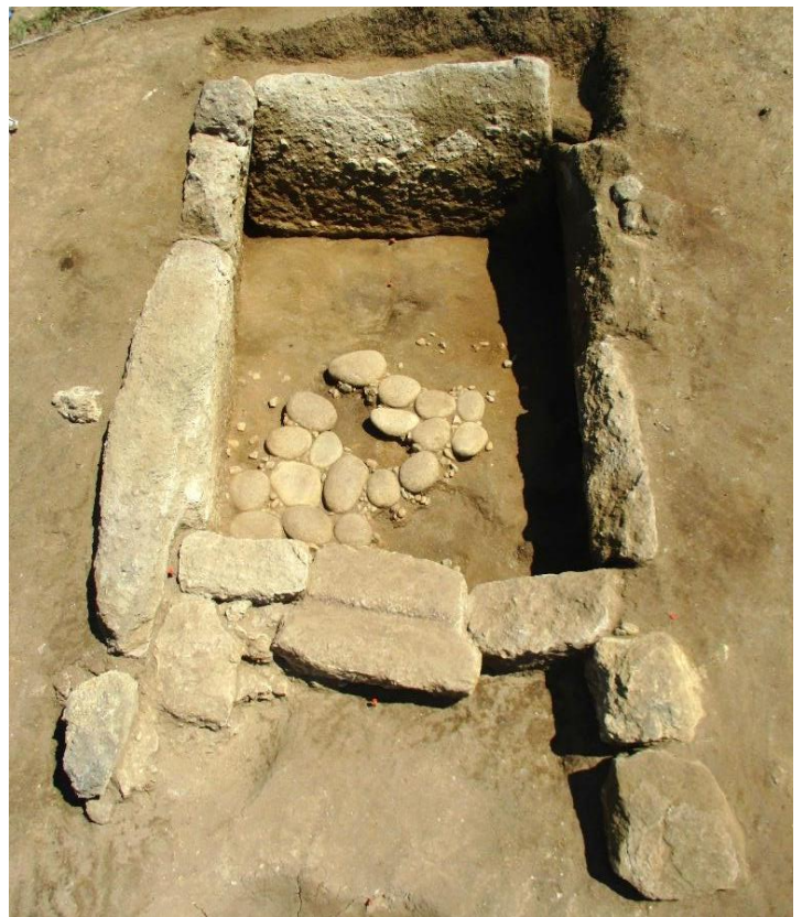
前方部の横穴式石室

なお、9月19日（土）に開催した現地説明会は、好天に恵まれ、多くの方々の参加がありました。（高橋）