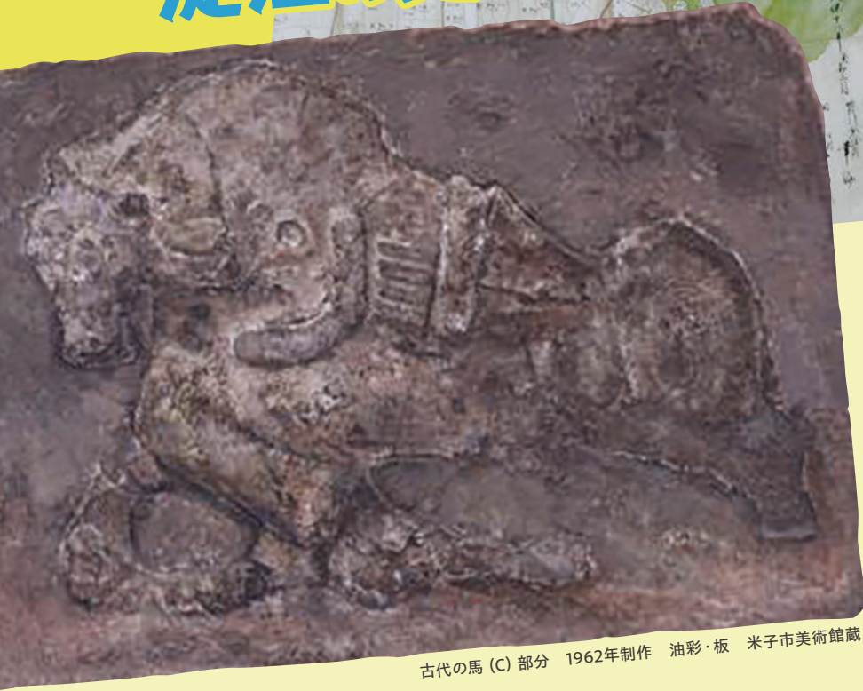
古代の馬 (C) 部分 1962年制作 油彩・板 米子市美術館蔵

淀江が生んだ郷土の画家國頭繁次郎が題材にした石馬などの淀江の史跡を巡り、普段は一般公開されていない繁次郎の作品も特別に鑑賞します。