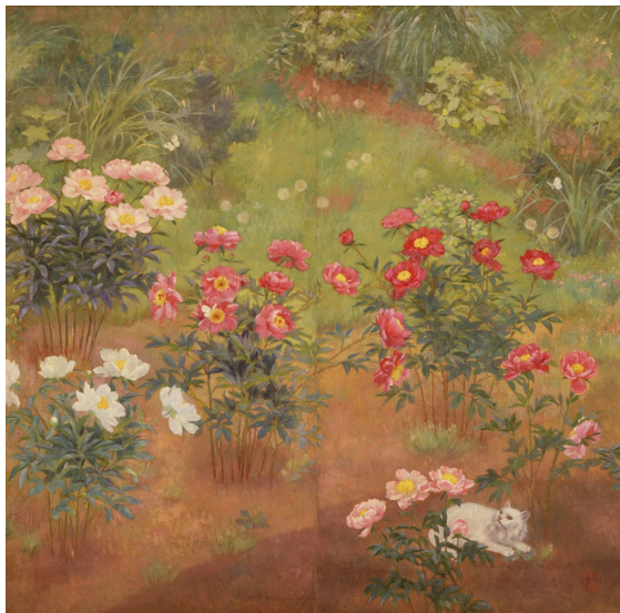
香田勝太「猫と芍薬」米子市美術館蔵