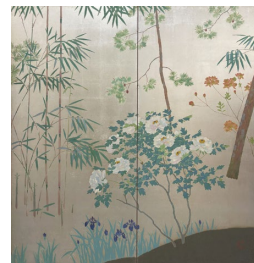
香田勝太《初夏の花弁図》制作年不詳 油彩・銀箔 二曲一隻 個人蔵・倉吉博物館寄託