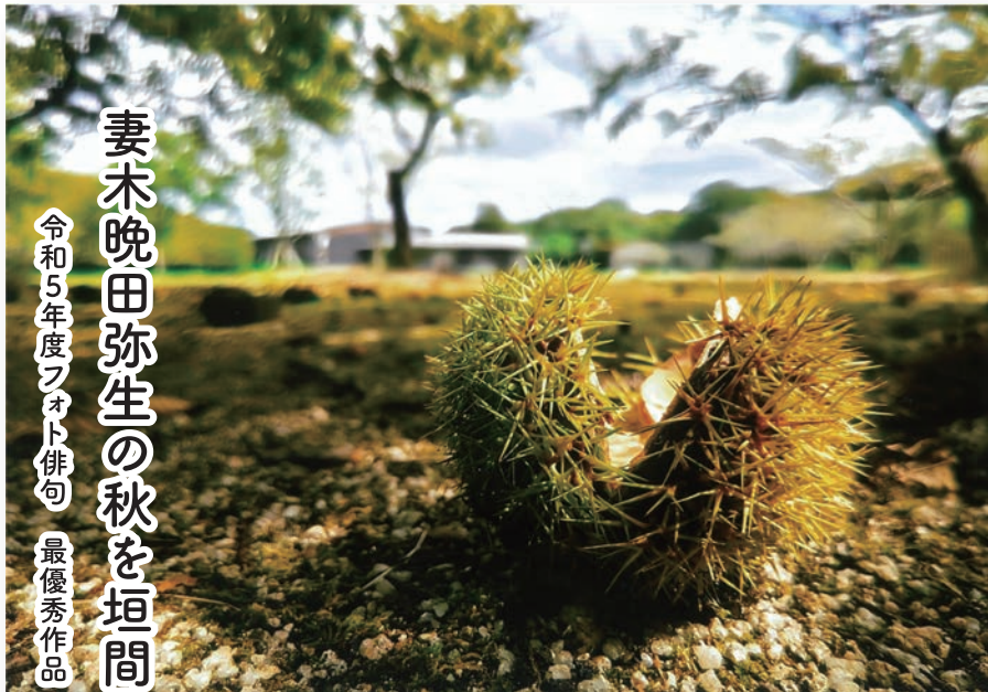
令和5年度フォト俳句 最優秀作品