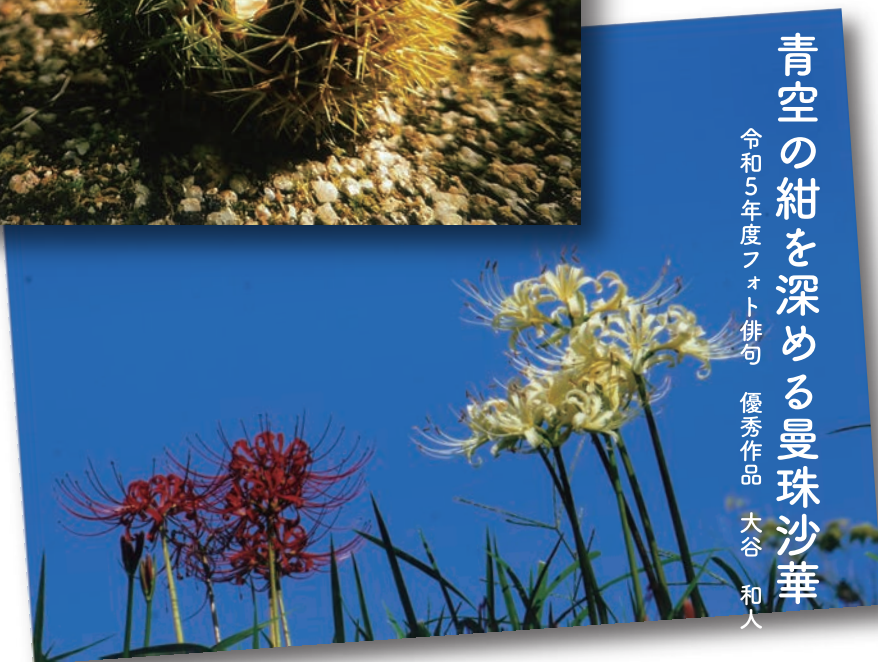
令和5年度フォト俳句 優秀作品 大谷 和人